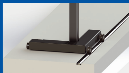
Überfahrbare Achslast: 18 t Nicht nivellierbar