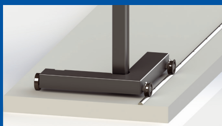
Überfahrbare Achslast: 18 t Nicht nivellierbar